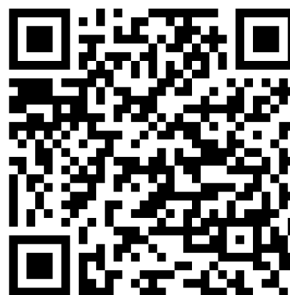
QR kód na Google Play

Tak Vám již nikdy neutečou informace o připravovaných kulturních akcích, svezích velkoobjemového odpadu, výpadcích elektrické energie, objížďkách či zasedání zastupitelstva obce.